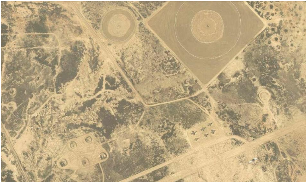
Fotografía: Bardenas Reales, Navarra, España

Para el presente semestre se propondrán tres ejercicios, el primero de ellos de un mes de duración consistirá en la elaboración de una cartografía en grupo que surgirá de la experiencia y estudio de la vivencia del lugar, con ello se pretende explorar la capacidad que tiene el dibujo para recoger el pensamiento y para proponer su construcción. Un segundo ejercicio de tres semanas de duración planteará la interacción con las infraestructuras obsoletas del territorio. Y un tercer ejercicio central, desarrollará un programa en el que se investigarán formas alternativas de acercamiento al proyecto arquitectónico desde la vinculación e interacción entre paisaje extremo, infraestructura y vivencia.